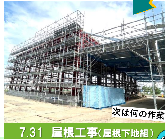
7.31 屋根工事(屋根下地組)