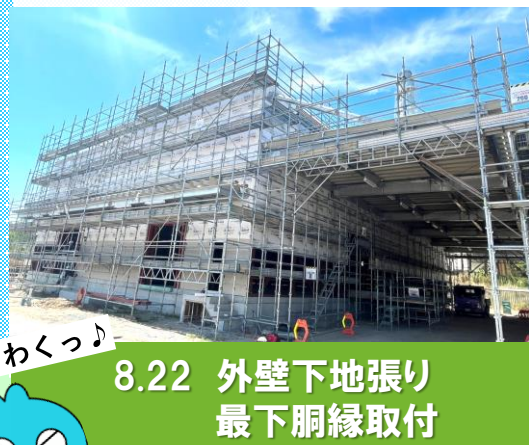
8.22 外壁下地張り 最下胴縁取付